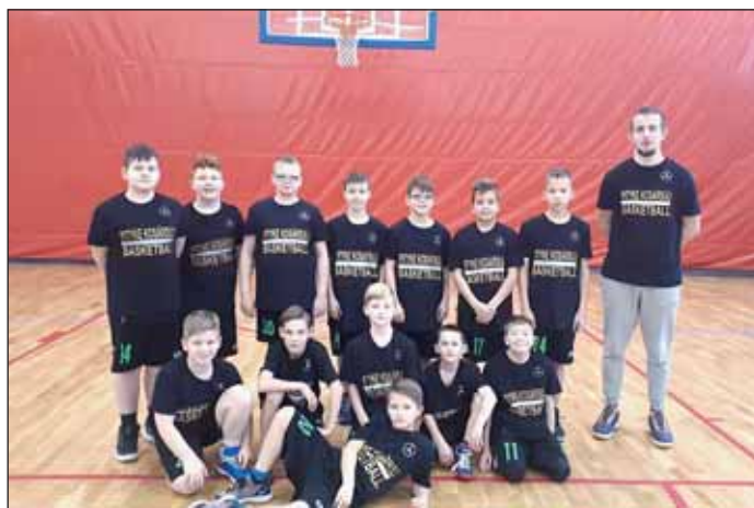
Fotó: U18 csapatkép: NSKE