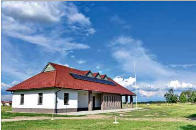
A vásártéri kiszolgáló épület és a Gál-kastélyig a kerékpárút is megépült

Elfogadásra került Nagykovács Város Önkormányzat 2020. évi zárszámadási rendelete, mely a Magyar Államkincstár felé benyújtásra került. Az előterjesztés általános értékelés részében olvasható: „A költségvetés 2020. évi eredeti előirányzata Nagykovács Város Önkormányzat Képviselő-testületének 2020. évi költségvetéséről szóló 2/2020. (II.15.) önkormányzati rendelet (továbbiakban: költségvetési rendelet) alapján 4.099.246 ezer Ft volt. A költségvetési rendelet módosítására négy alkalommal került sor, a 2020. évi költségvetési maradvány jóváhagyására, valamint a bevételi többletek felosztására figyelemmel, melynek következtében a bevételi és a kiadási főösszeg 5.964.341 ezer Ft-ra változott.”