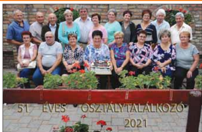
A Petőfi Sándor Általános Iskolában 1970-ben végzett osztály találkozóját a Budai Kapu Étteremben rendezte meg.