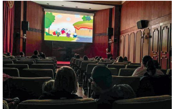
Interaktív családi nap