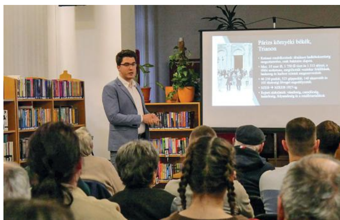
Hadtörténeli előadás sorozat