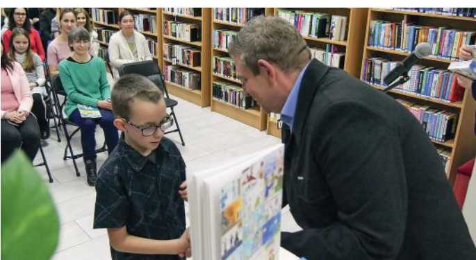
Válogatás Arany László mesegűjteményéből