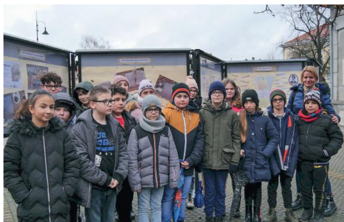
Az Én Petőfim című szabadtéri időszaki kiállítás